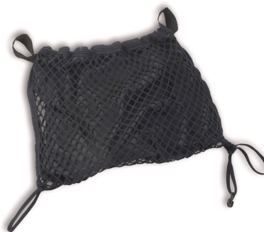
Bolsa para el respaldo (REF.H8660)