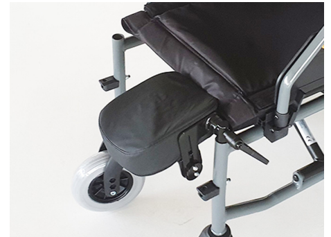
Soporte para amputados. Derecho (REF.AGR3) Izquierdo (REF.AGR4)