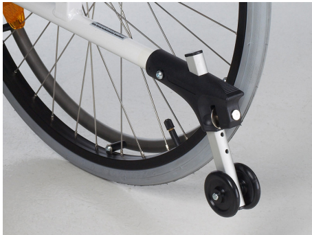
Ruedas antivuelco (REF.402584)