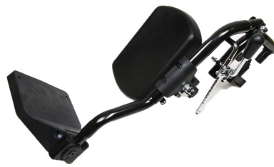
Reposapiés elevables. Derecho (REF.AGR1) Izquierdo (REF.AGR2)